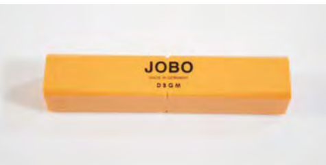
32 155 00 JOBO Glasbrechstab JOBO glass breaking device