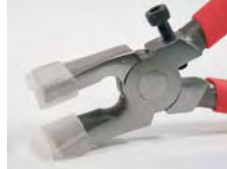
32 115 00 PROVETRO PRP-1 (für / for 2 - 6 mm Glas / glass) Laufzange 205 mm L., 24 mm Backenbreite, Metall, mit Stellschraube, Griff und Backen ummantelt Running pliers, 205 mm, 24 mm jaw width, metal, leveling screw, coated grip and jaw