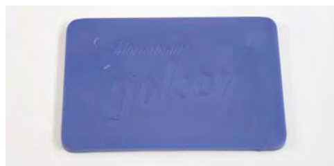
36 165 00 JOKER Silberschnitt Brechhilfe JOKER glass breaking device