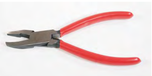
32 127 00 KNIPEX Brech- und Kröselzange, 160 mm Länge, 4 mm Backenbreite, ölgehärtete Backen, ummantelter Griff Breaking and grozing pliers, 160 mm, 4 mm jaw width, oil tempered jaw, coated grip