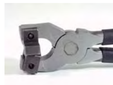
32 117 10 PROVETRO PRP-4 (für / for 4 - 19 mm Glas / glass) Dickglas Laufzange, 230 mm L., 50 mm Backenbreite, ummantelter Griff / Pliers for thick glass 230 mm, 50 mm jaw width, coated grip