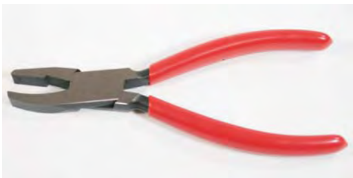
32 120 00 KNIPEX Brech- und Kröselzange, 160 mm Länge, 10 mm Backenbreite ölgehärtete Backen, ummantelter Griff Breaking and grozing pliers, 160 mm l., 10 mm jaw width, oil tempered jaw, coated grip