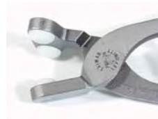
32 117 00 PROVETRO PRP-2N (für / for 6 - 12 mm Glas / glass) Dickglas Laufzange, 230 mm Länge, 45 mm Backenbreite, Backn mit Kunststoff belegt, ummantelter Griff Pliers for thick glass, 230 mm, 45 mm jaw width, plastic tips, coated grip