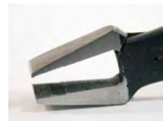
32 140 00 KNIPEX Brechzange, 180 mm, 22 mm Backenbreite, erleichtert das Brechen von schmalen Streifen Breaking pliers, 180 mm, 22 mm jaw width, easy breaking of small strips