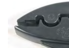
32 112 01 Laufzange "Snappers" / Runner pliers "Snappers"