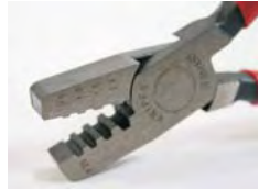
32 186 00 KNIPEX Aderendhülsen-Zange / Crimping pliers for cable links