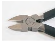
32 170 00 Bleiseitenschneider PLP 7 / Lead came cutter