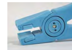
32 101 00 BLUE RUNNER Laufzange, Kunststoff Running pliers, plastic