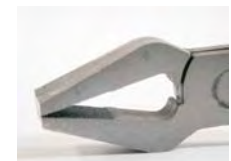
32 118 30 PROVETRO P-510 (für / for 3 - 16 mm Glas / glass) Dickglas Brechzange, 210 mm, 23 mm, Backenbreite, ummantelter Griff / Pliers for thick glass, 210 mm, 23 mm jaw width, coated grip