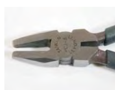
32 134 00 PROVETRO PCJ-8, Fischlippen-Kröselzange, 165 mm, 5 mm Backenbreite, ummantelter Griff (ideal für 2 - 5 mm Glas) Grozers pliers "Fishlip", 165 mm, 5 mm jaw width, coated grip, (for 2 - 5 mm glass)