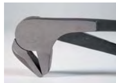
32 118 10 PROVETRO P-310 (für / for 3 - 12 mm Glas / glass), Dickglas Brechzange, 210 mm Länge, 23 mm Backenbreite, ummantelter Griff / Pliers for thick glass, 210 mm, 23 mm jaw width, coated grip