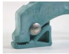
32 112 00 Glasgreifer, fixiert beim Schleifen auch kleinste Glasstücke problemlos Glass Holding pliers securely grips small glass pieces while grinding