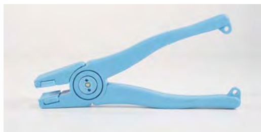
32 111 02 RING STAR Ersatzbacken, Replacement jaw,