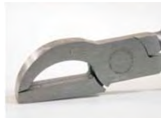
32 118 20 PROVETRO P410 (für / for 3 - 12 mm Glas / glass) Spiegeldickglasbrechzange, 185 mm Länge, 15 mm Backenbreite, ummantelter Griff / Breaking pliers for mirrors, 185 mm, 15 mm jaw width, coated grip