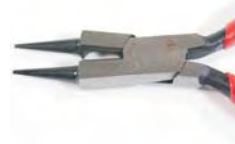
32 185 00 KNIPEX Schmuckbiegezange, mini / Needle nose pliers, mini