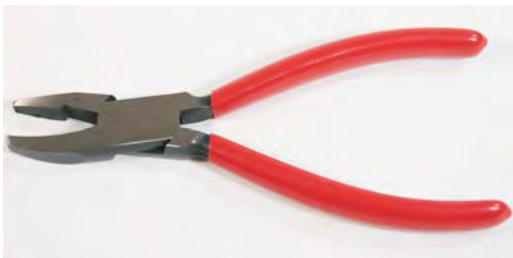
32 125 00 KNIPEX Brech- und Kröselzange, 160 mm Länge, 5 mm Backenbreite, ölgehärtete Backen, ummantelter Griff Breaking and grozing pliers, 160 mm l., 5 mm jaw width oil tempered jaw, coated grip