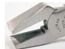
32 118 00 PROVETRO P-210 (für / for 3 - 12 mm Glas / glass) Dickglas Brechzange, 220 mm, 22 mm Backenbreite, ummantelter Griff / Pliers for thick glass, 220 mm, 22 mm jaw width, coated grip