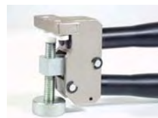
32 119 00 BOHLE Schnittlaufzange (für / for 6 - 15 mm Glas / glass) Ganzmetall, mit Stellschraube zur individuellen Einstellung auf die jeweilige Glasdicke, optimale Kraftübertragung, ideal auch für das Öffnen gerader Schnitte und Eckausschnitte etc. Cut runnig plier. All metal, with adjustable screw to set to individual glass thickness, optimum load transmission, also ideal to open straight cuts, corner cut outs, etc.