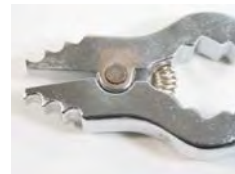
32 190 00 Kettenzange / Pliers for chains