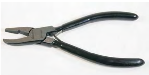
32 126 00 BOHLE Kröselzange, 160 mm Länge, 4 mm Backenbreite, kunststoffüberzogene Griffe, Kopf geschliffen, Rückstell feder für selbsttätiges Öffnen der Backen. Grozing pliers, 160 mm, 4 mm jaw width, plastic coated handles, ground head, with pull-back spring for automatic opening of the jaws.