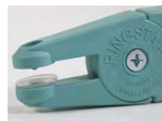
32 111 00 RING STAR Laufzange, Kunststoff Running pliers, plastic