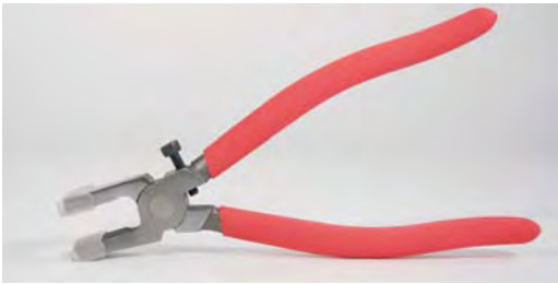
32 115 11 Ersatzpaarschuhe für 32 115 00 Replacement tip for 32 115 00 32 115 12 Ersatzpaarschuhe für PRP-7 Replacement tip for PRP-7