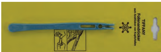
36 110 00 Foliendrücker / für alle Breiten Foil burnisher / for all sizes