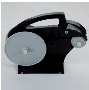
36 140 00 GLASTAR Folienanroller Foiler