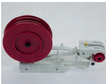
36 141 00 INLAND Folienanroller Foiler

Der Foliendrücker drückt die aufgetragene Folie gleichzeitig auf beiden Seiten an. Sie schonen Ihre Fingernägel.