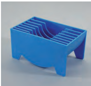
36 130 00 Folienbox für 7 Rollen mit unterschiedlichen Foil dispenser for 7 rolls with different sizes