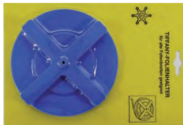
36 100 00 Folienhalter für 1 Rolle (alle Breiten) Foil holder for 1 roll (all sizes)