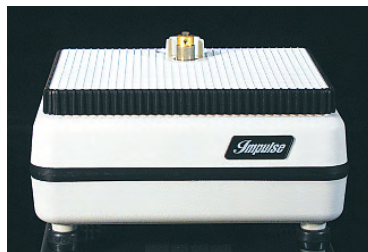
30 117 00 INLAND Impulse 230 x 255 mm Arbeitsfläche (beidseitig verwendbar), 3500 U/min, Thermoschutz, TouchTop - Schalter, 25 und 6 mm Schleifköpfe

230 x 255 mm work surface (double sided), 3450 rpm, thermal protection, 19 mm bit