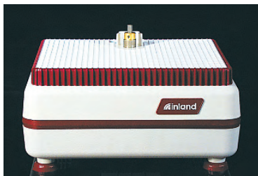
30 120 00 INLAND Contour 230 x 255 mm Arbeitsfläche (beidseitig verwendbar), 3450 U/min, Thermoschutz, 19 mm Schleifkopf

230 x 255 mm work surface (double sided), 3450 rpm, thermal protection, TouchTop switch, 19 mm bit