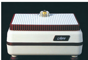
30 116 00 INLAND Aero 230 x 255 mm Arbeitsfläche (beidseitig verwendbar), 3450 U/min, Thermoschutz, TouchTop - Schalter, 19 mm Schleifkopf

230 x 255 mm work surface (double sided), 3450 rpm, thermal protection, TouchTop switch, 19 mm bit