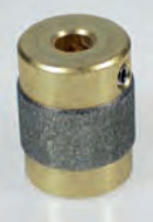
Schleifkopf / Diamond bit