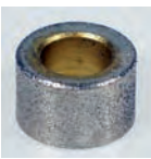
Schleifkopf, 16 mm, für Schleifmaschine G51 Diamond bit, 16 mm, for grinder G51