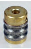
Spiegelschleifer / Mirror bit, 25 mm