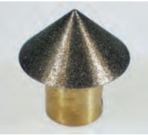
Entgrater / Deburrer, 35 mm