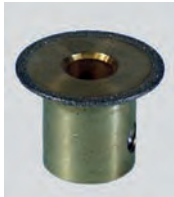
Rillenschleifer, diamant 25 mm, 1 mm Grooving bit, diamond 25 mm, 1 mm